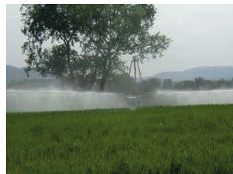
Závlahová konzola 40/50, inštalovaná na závlahovom vozíku (na zavlažovanie jemných a mladých rastlín) pásového zavlažovača