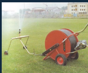
Model 40/110 - Sériá Sport & Garden