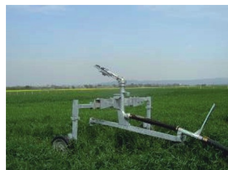
Pomaly vratné, sektorové vodné delo Komet TWIN 140, inštalované na závlahovom vozíku pásového zavlažovača

Na závlahové stroje poskytujeme záručný servis, náhradné diely, zaškolenie obsluhy strojov, periodický kontakt s každým partnerom, aby bola závlaha zabezpečená vždy práve včas.