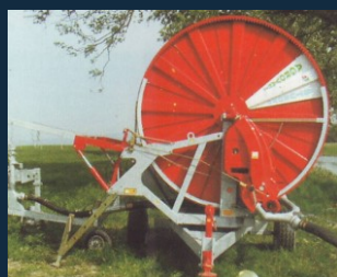
Model 110/300 - Sériá Gold