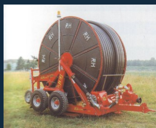
Model 120/650 - Sériá Major