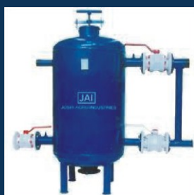
Pieskový filter na hrubé nečistoty