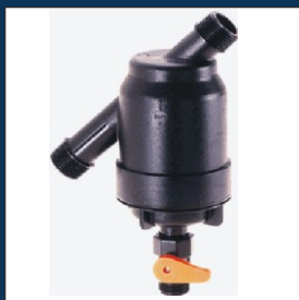
Sieťové a diskové filtre na jemnú filtráciu