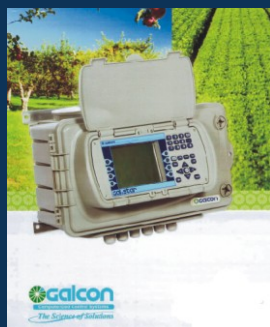
Riadiace počítače GALCON