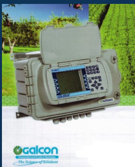
Riadiace počítače GALCON