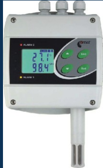
Senzory na kontrolu vlhkosti a elektrickej vodivosti EC