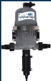
Dávkovače živín a rozpustných hnojív NPK