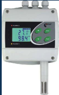
Senzory na kontrolu vlhkosti a elektrickej vodivosti EC