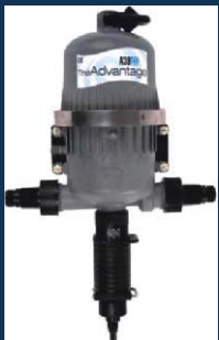
Dávkovače živín a rozpustných hnojív NPK